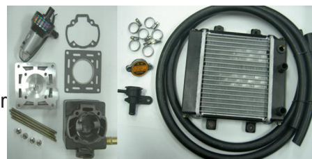
Dio 54 mm de agua fría del cilindro kit (94.8cc)