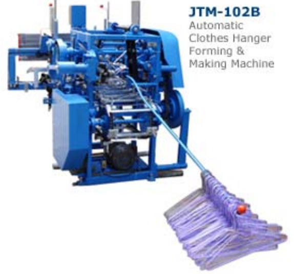
JTM-102B Automatic Clothes Hanger Forming & Making Machine

معترف بها على نحو متزايد من قبل عملائها في جميع انحاء العالم 656537490 , رقم التسجيل D&B D-U-N-S الشركة مع في السنين القليلة الماضية , بسبب قيامها بتحسين الاتها لتغطي قدرة اعلى وأبعاد أقل وتخفيض نسبة الادخال اليدوي .